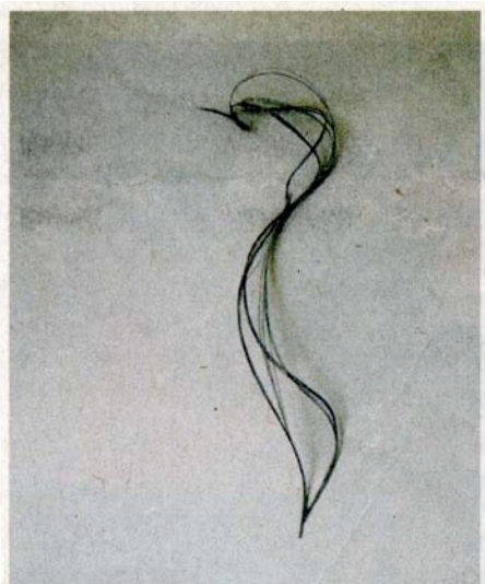
■ De werken Gyrus , Dolores en Cecilia ver 'Wat in je hoofd zit, kun je niet zien en niet

Noack vindt dat Dujourie al present had moeten zijn op een van de voorbije Documenta's. Bijvoorbeeld bij die van Jan Hoet in 1992? Het antwoord van Dujourie klinkt afgemeten. "Dat moet u aan hem vragen."